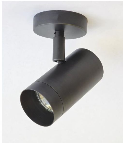
LUNGO ST in geborsteld brons. Metaal afwerking code: 29