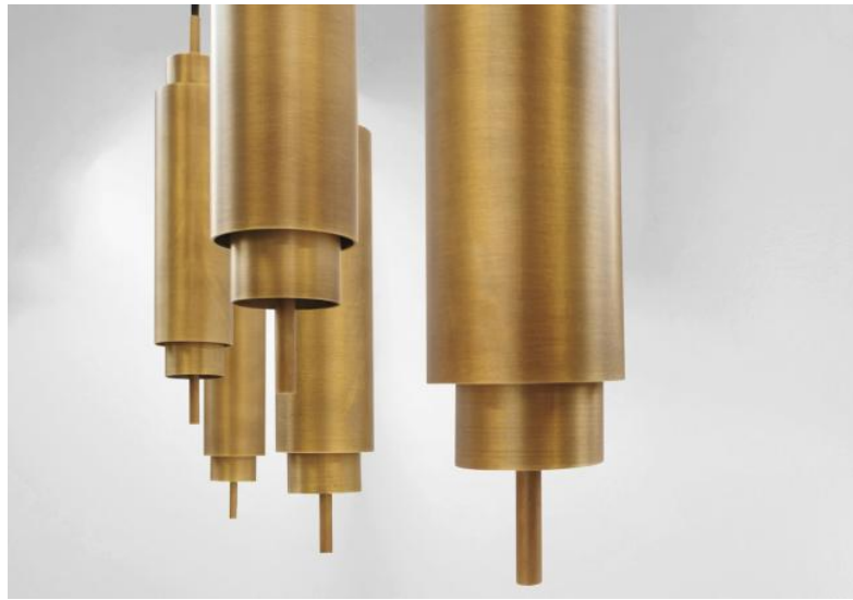
Hanglamp TOKYO 5 # in lichtbrons. Metaal afwerking code: 28