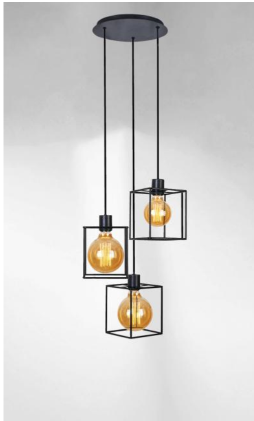
KERMA 3 o26 in geborsteld brons met structuren in zwarte epoxy afwerking