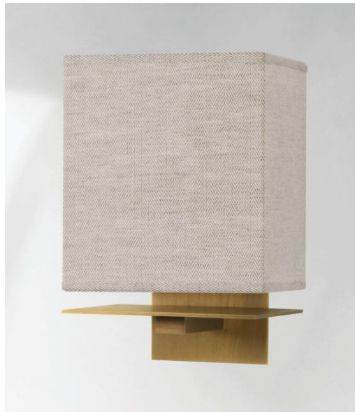
NAGANO in lichtbrons met lampenkap in Lin Bergen (stof uit categorie 2)