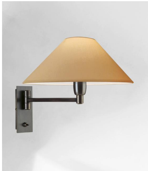
SOKARIS +SW in geborsteld brons met lampenkap in Coton Sahara (stof uit categorie 1)