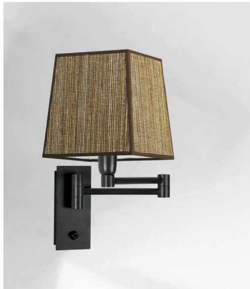
AHMOSIS +SW in geborsteld brons met lampenkap in Jacinthe Miel Noir (materiaal uit categorie 5)