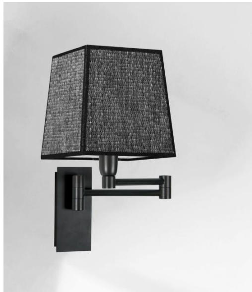
AHMOSIS -SW in geborsteld brons met lampenkap in Parma Régliste (stof uit categorie 4)