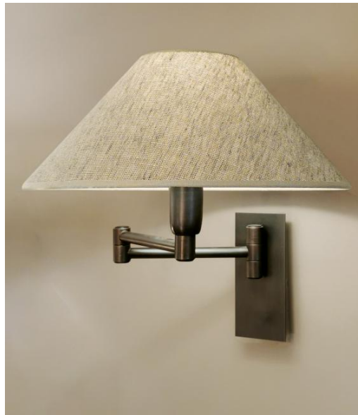
AHMOSIS -SW in geborsteld brons met lampenkap in Stone Calcite (stof uit categorie 4)