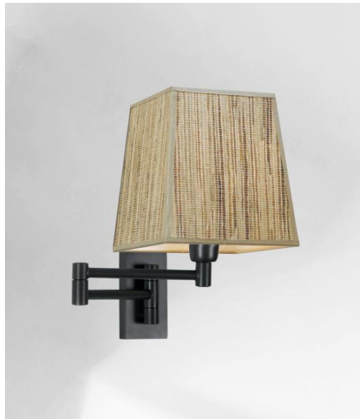
MAMMISI -SW in geborsteld brons met lampenkap in Jacinthe Naturelle (materiaal uit categorie 5)