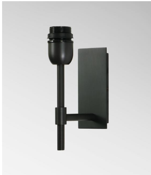
NECTANEBO 1 in geborsteld brons zonder lampenkap