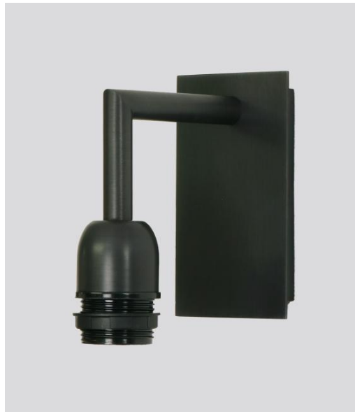
EDFOU 2 in geborsteld brons zonder lampenkap