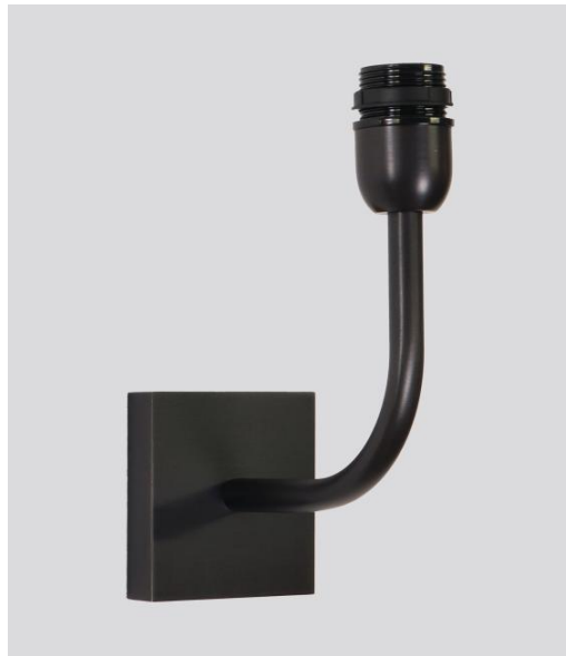
ABA 2 in geborsteld brons zonder lampenkap