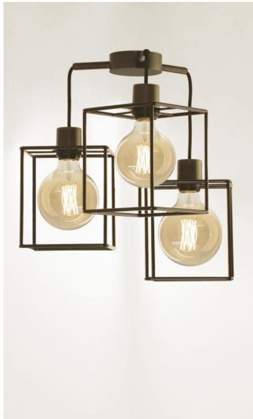
KERMA 3 CEILING in geborsteld brons met structuren in zwarte epoxy afwerking