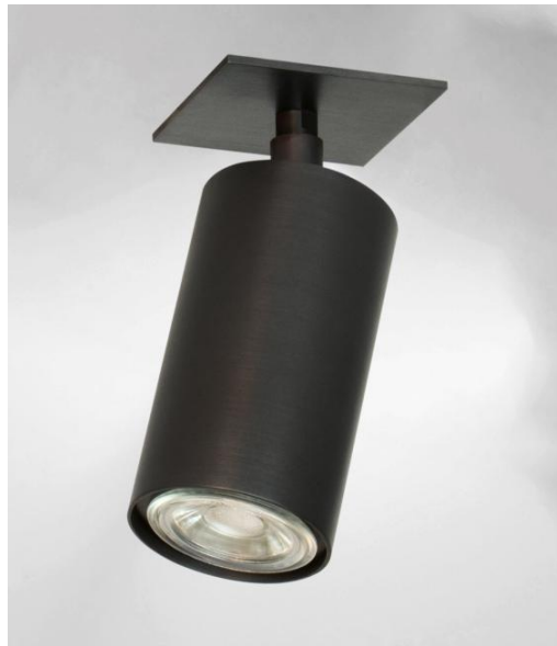
DEIMOS P1 # in geborsteld brons. Metaal afwerking code: 29