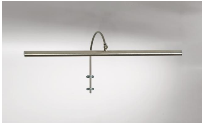
TRIANON 60 in gesatineerd nikkel. Metaal afwerking code: 33