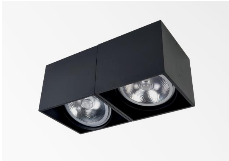
ATRIA 2 MOBILE in gestructureerd zwart. Metaal afwerking code: 02