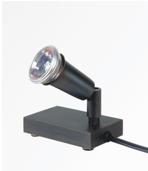
MICRON PL in geborsteld brons. Metaal afwerking code: 29