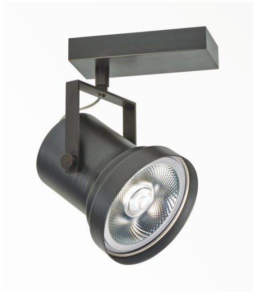
ATHENA 1 in geborsteld brons. Metaal afwerking code: 29