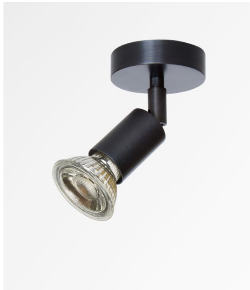
MERCURE ST in geborsteld brons. Metaal afwerking code: 29