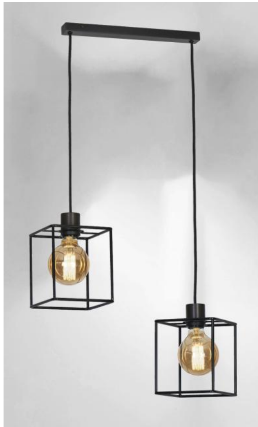
KERMA L 2 in geborsteld brons met structuren in zwarte epoxy afwerking