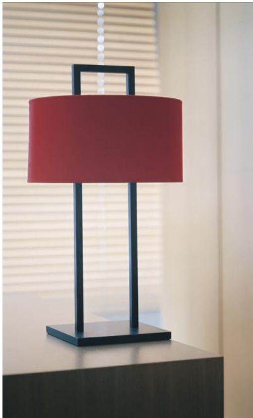
SATIS in geborsteld brons met cilindervormige lampenkap in Seta Framboise (stof uit categorie 3)