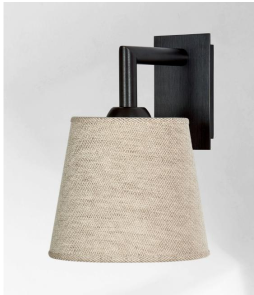
EDFOU 1 in geborsteld brons met lampenkap in Lin Bergen (stof uit categorie 2)