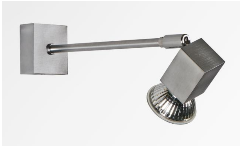
PEGASE in gesatineerd nikkel. Metaal afwerking code: 33