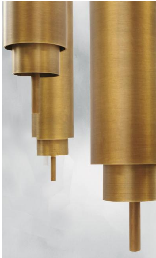
TOKYO 3 ø20 en bronze léger. Finition du métal : code 28