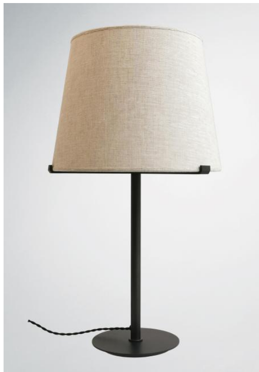
MALMÖ 1 o en bronze griffé avec abat-jour conique en Lin Moscou (tissu de catégorie 2)