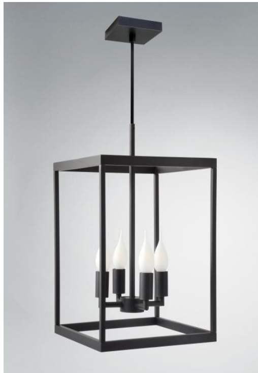
CHAMBORD #27 en bronze griffé. Finition du métal : code 29