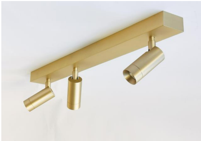
ALTA 3 en laiton satiné. Finition du métal : code 25 (option)