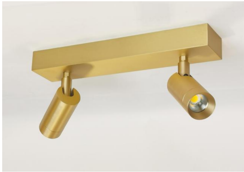
ALTA 2 en laiton satiné. Finition du métal : code 25 (Option)