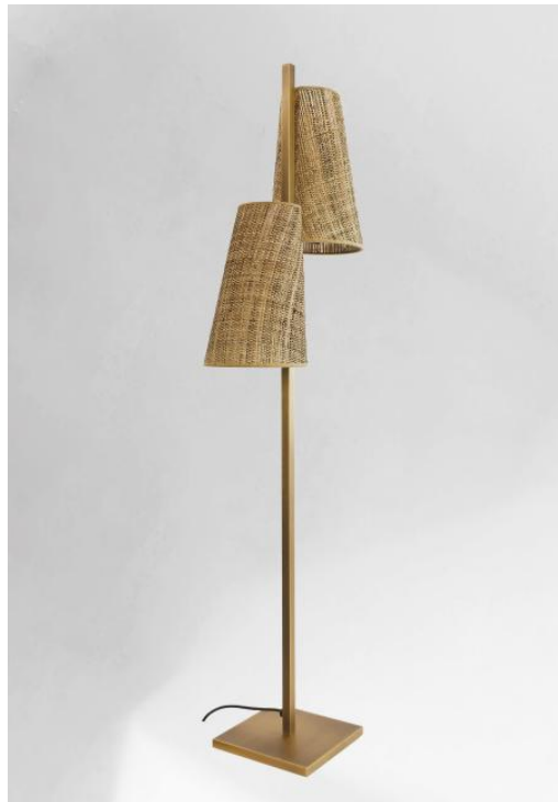
FENICE en bronze léger avec abat-jour en Raphia Banane (matière de catégorie 3)