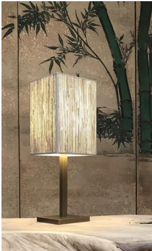
TASJA en bronze léger avec abat-jour en Jacinthe Naturelle (matière de catégorie 5)