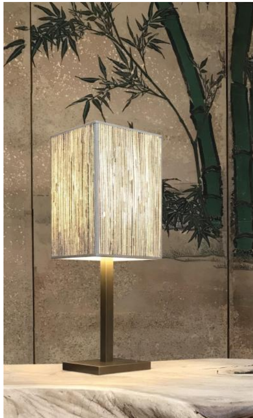
TASJA en bronze léger avec abat-jour en Jacinthe Naturelle (matière de catégorie 5)