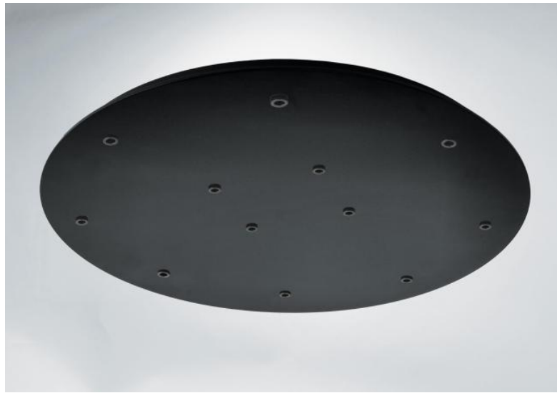
CEILING BASE 12 o58 en noir structuré (code : 02). Options : câbles et de douilles (+supplément)