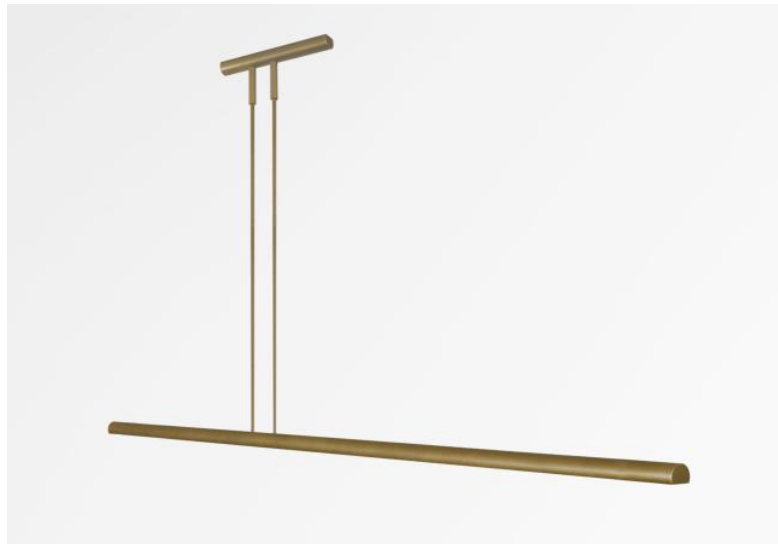
AXELL 120 en bronze léger