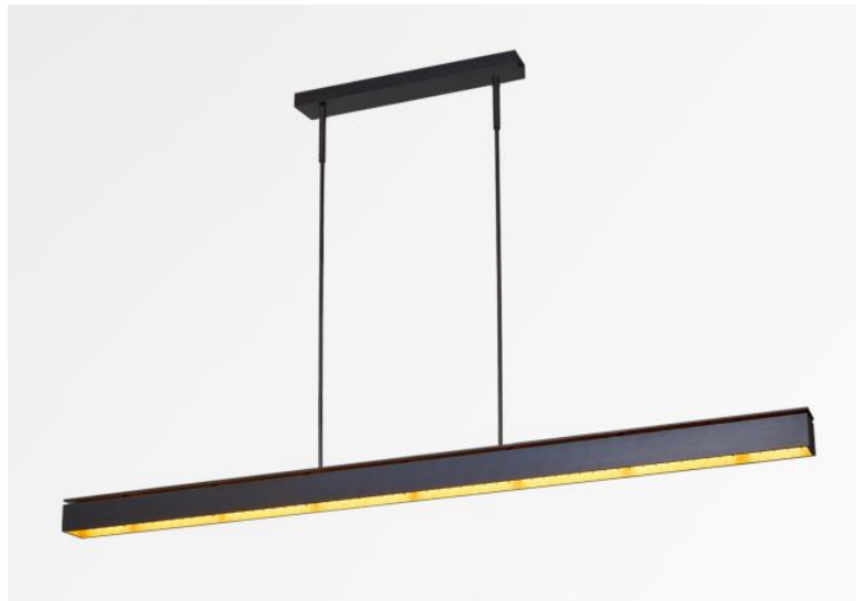
GALAND J tubes en bronze griffé. Finition du métal : code 29