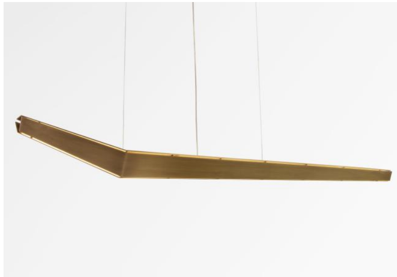
LUNGA # en bronze léger