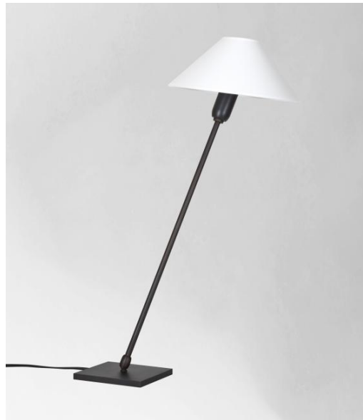
TANIS 2 en bronze griffé avec abat-jour conique en Bristol (matière de catégorie 1)