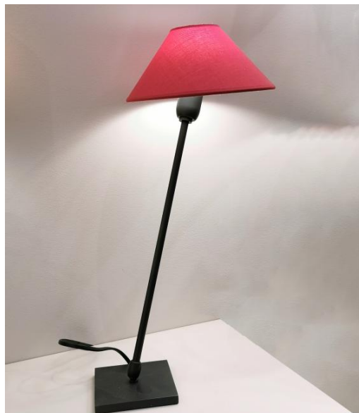
TANIS 1 en bronze griffé avec abat-jour en Coton Groseille (tissu de catégorie 1)