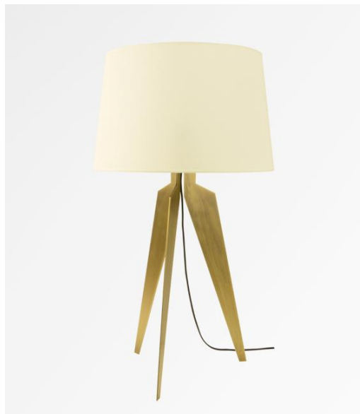
ALBI 2 en bronze léger avec abat-jour en Bombay Champagne (tissu de catégorie 1)