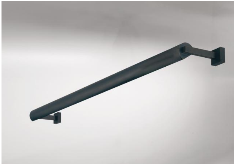
ALEXANDRIE 80 en bronze griffé. Finition du métal : code 29