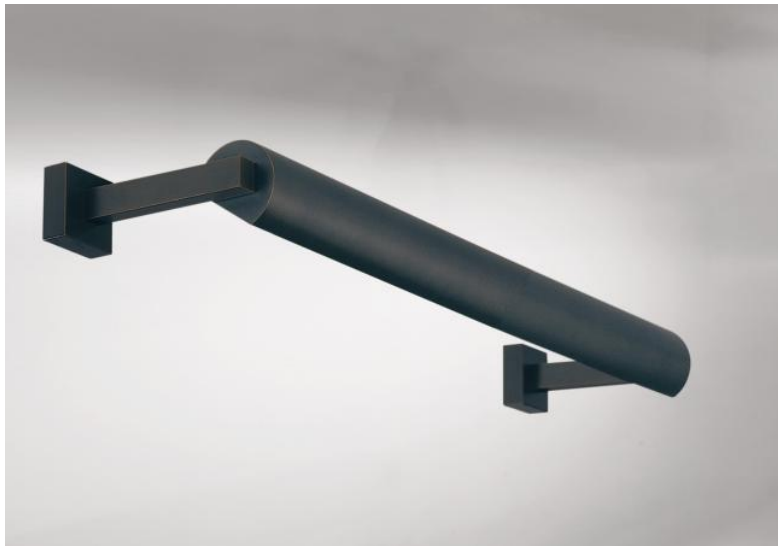
ALEXANDRIE 40 en bronze griffé. Finition du métal : code 29