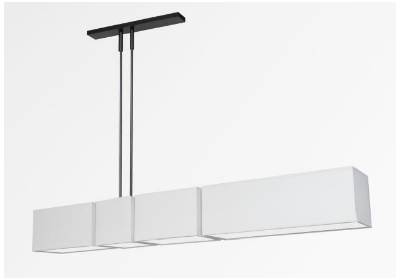
WRIGHT en bronze griffé avec abat-jour en Madison naturel (tissu de catégorie 2)