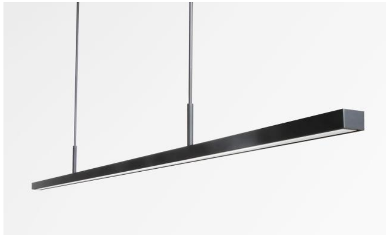
POLARIUS 150 en bronze griffé. Code de la finition : 29