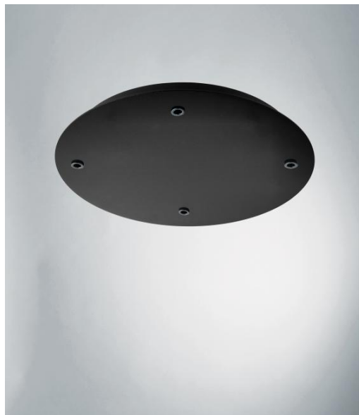
CEILING BASE 4 o26 en noir structuré. Finition du métal : code 02. En option : un grand choix de câbles et de douilles (+supplément)