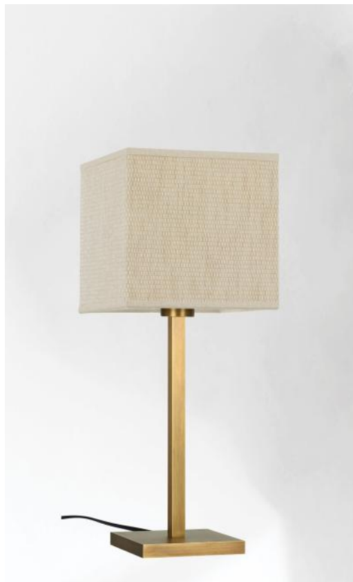
MENNA 1 en bronze léger avec abat-jour en Parma Merisier (tissu de catégorie 4)