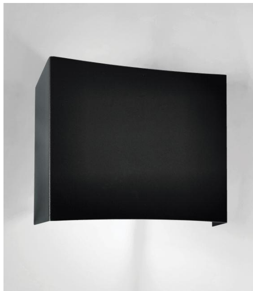
NAXOS en noir structuré. Finition du métal : code 02