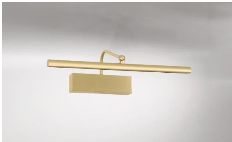
VERSAILLES 35 en laiton satiné. Finition du métal : code 25