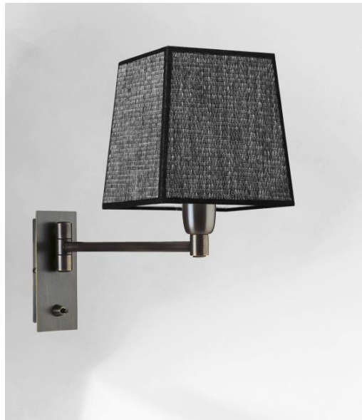
SOKARIS +SW en bronze griffé avec abat-jour en Parma Réglisse (tissu de catégorie 4)