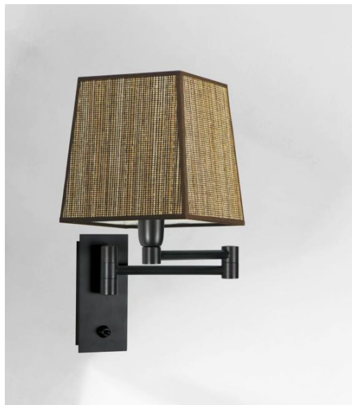
AHMOSIS +SW en bronze griffé avec abat-jour en Jacinthe Miel Noir (matière de catégorie 5)