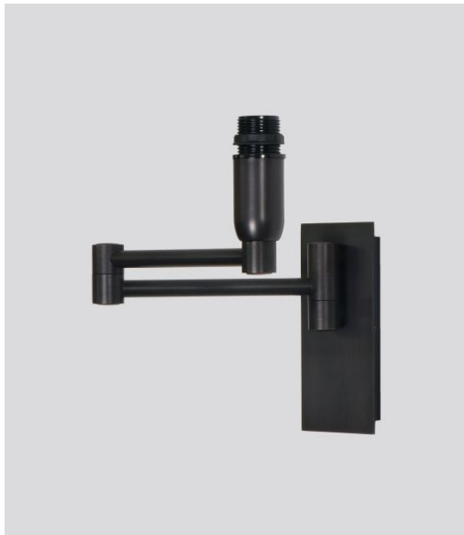
AHMOSIS -SW en bronze griffé sans abat-jour