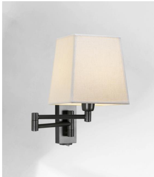
MAMMISI +SW en bronze griffé avec abat-jour en Stone Kaolin (tissu de catégorie 4)