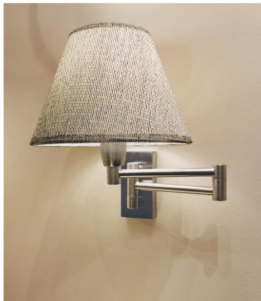
MAMMISI en chrome satiné avec abat-jour en Esmaria Avoine (tissu de catégorie 3)